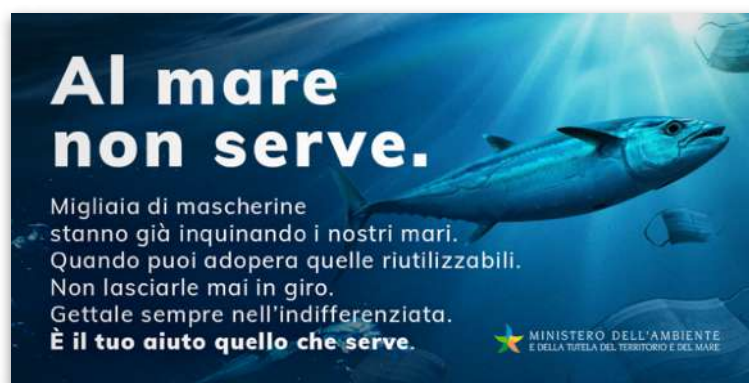
Una delle grafiche della campagna dedicata al mare

Qui trovate il link alla pagina del Ministero: https://www.minambiente.it/all-ambiente-non-servono .